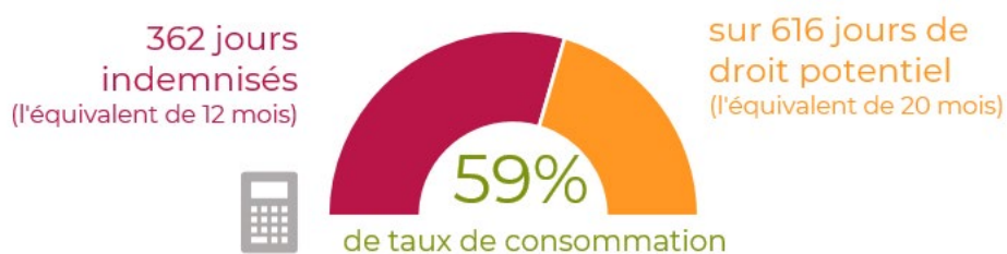
GRAPHIQUE 1 – TAUX DE CONSOMMATION DU DROIT EN MOYENNE EN 2019